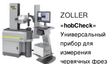
ZOLLER »hobCheck« Универсальный прибор для измерения червячных фрез